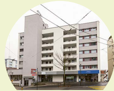
Wohngruppe Ü60 Neuhausen