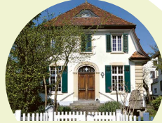
Wohnschule Rheingoldstr. 35, 8212 Neuhausen