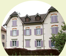
Aussenwohnungen Neuhausen und Schaffhausen