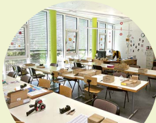
Ateliers Industriestr. 31, 8212 Neuhausen