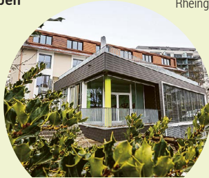
Wohnheim Industriestr. 31, 8212 Neuhausen